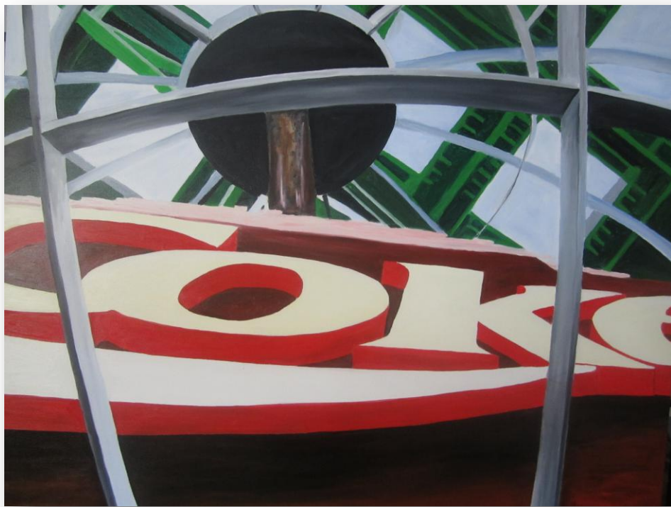
„Coke in Atlanta“ Öl auf Leinwand 100/120 USA 2012