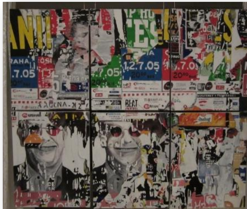
48 Serie gemalte Plakatabrisse „Wien 1“ Öl auf Leinwand 70/100 2010